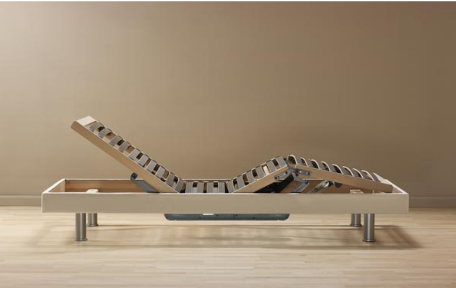
Bettbasis Selecta LC Buche massiv, Möbelstoff bezogen, 2-Matic

Selecta LC ist die Basis für gutes Liegen. „Lättli Couche“ nennen es die Schweizer liebevoll und meinen die elegante vielseitige Bettbasis mit integriertem Lattenrost. Sie lässt sich mit der Selecta Matratze Ihrer Wahl ausstatten und bietet durch die verschiedenen Varianten von mechanischer oder motorischer Verstellung ein zusätzliches Komfortplus. Eine Auswahl von Oberflächen, Fußvarianten sowie das Wandboard eröffnen individuelle Gestaltungsmöglichkeiten.